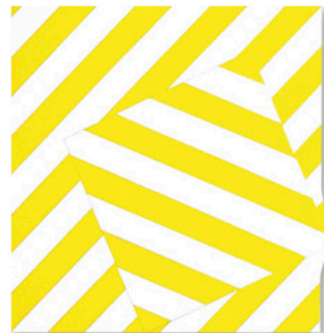
André Stempf. Band's . 2008, encre vinylique sur toile, 100 x 100 cm.

« géométriques » et des « concrets », avec leurs œuvres construites selon des règles mathématiques, telles celles de Ellsworth Kelly (1953-54), Seuphor (1957 à 65) et Honegger (1965 à 68), soutenus par un puissant réseau de galeries en Europe du Nord, aux États-Unis et en Australie.