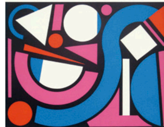
Réalités Nouvelles 1955 Numéro 9

Auguste Herbin en couverture du catalogue numéro 9 du 10 e Salon Réalités Nouvelles en 1955.