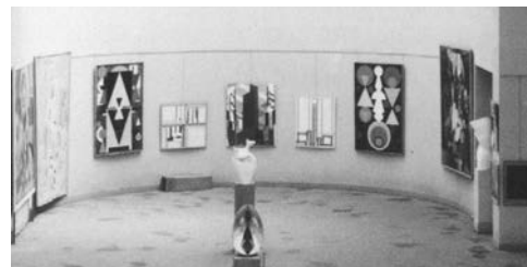
3 e Salon Réalités Nouvelles en 1948 au Palais des Beaux-Arts de la Ville de Paris. Au centre, deux tableaux d'Auguste Herbin – Apollon-Dionysos et Léline-Staline (1948) – encadrant trois tableaux de František Kupka – Série C VIII (1935-1946), Architecture philosophique (1913-1932) et Élévation, Série CIII (1932)

Aujourd'hui, Réalités Nouvelles se diversifie avec des versions du Salon hors-les-murs comme à Belgrade (2013), à Pékin (2014) et cette année à Shenyang en Chine (2019) et à Budva au Monténégro (2019). En 2015, Réalités Nouvelles a ouvert un lieu d'exposition à Paris : Abstract Project, Espace des arts abstraits , au 5 rue des Immeubles Industriels, 75011 Paris. Gérée sur le modèle des nonprofit galleries par un collectif d'artistes des RN, la galerie accueille tous les abstraits – du Salon ou non – pour leur offrir une autre visibilité en complément du salon annuel. www.abstract-project.com