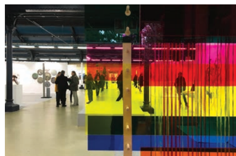
71 e Salon Réalités Nouvelles en 2017 au Parc Floral. Au premier plan, détail de la sculpture Prismes d'Elliott Gausse et Kenia Almaraz Murillo