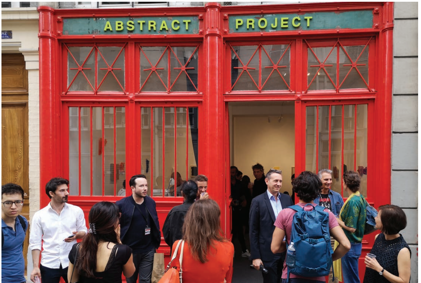
ABSTRACT PROJECT, Espace des arts abstraits | 91 e exposition de la nonprofit galerie gérée par l'association Réalités Nouvelles, 5 rue des Immeubles Industriels 75011 Paris | vernissage de l'exposition d'Anyà Pesce et Lisa Sharp "30x30 : prêt-à-porter", 14 août 2019