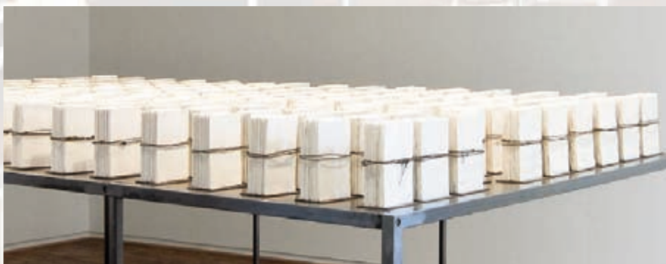
Elisabeth BRILLET , Dans le silence des Psaumes [détail], 2011, estampes de la totalité du Livre des Psaumes sur feuilles de porcelaine et acier, 110 x 280 x 174 cm