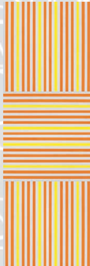
Laura GETHEN-SMITH , Mayapore , 2012, huile sur toile, 150 x 50 cm