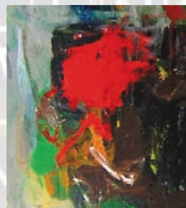
ULRICH , Sans titre [détail], 2011, acrylique sur toile, 149 x 114 cm