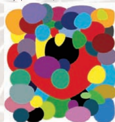
Joël CHASSERIAU , Jour de fête , 2011, acrylique sur toile, 144 x 133 cm