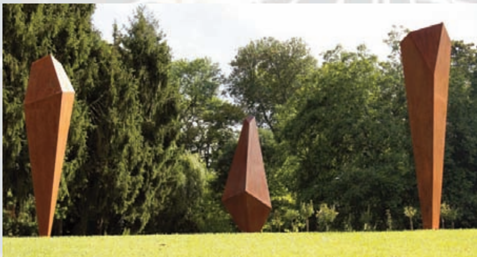
José AGUIRRE , Atzera Umetoki Orri , 2011, acier Corten, 350 x 120 x 90 cm