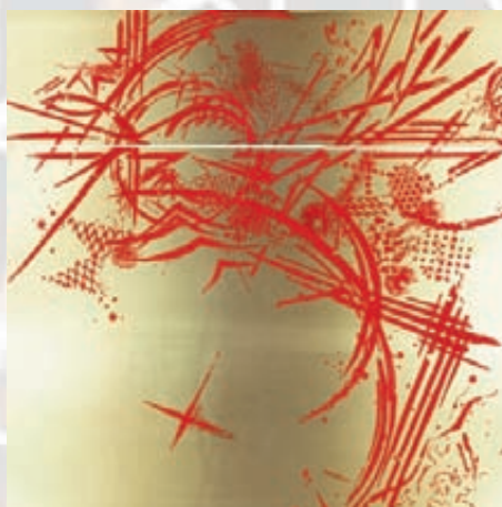
Eve STEIN , Arioso [détail], 2011, gravure au sucre et aquatinte sur papier, 50 x 40 cm