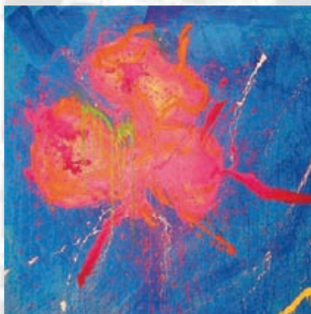
Erik LEVESQUE , L'œil mystérieux [détail], 2010, acrylique, aluminium et cendre sur toile, 250 x 200 cm