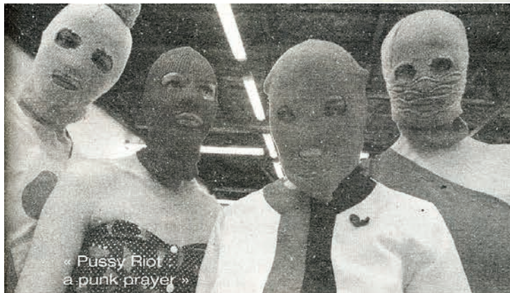
« Pussy Riot : a punk prayer »